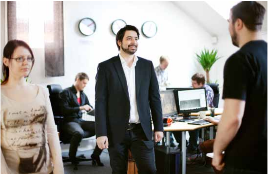
Dohi Sweden har expanderat till 12 heltidsanställda med verksamhet i Umeå och Stockholm.